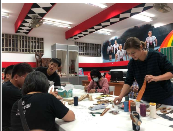
名稱：原住民樹皮工藝坊 日期：109 年 11 月 25 日