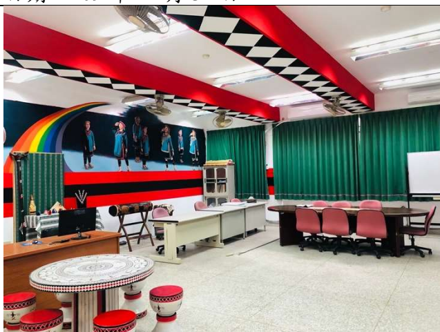
活動：優化原資中心休憩聯誼學習空間 日期：109 年 12 月 31 日