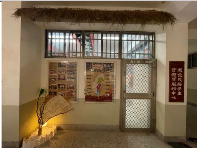
活動：優化整體美化後的原資中心 日期：109 年 12 月 31 日