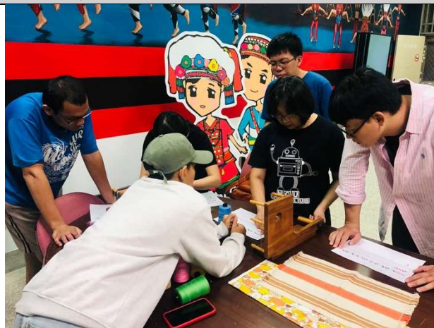
活動：Tminum 文化體驗活動 日期：109 年 9 月 21 日