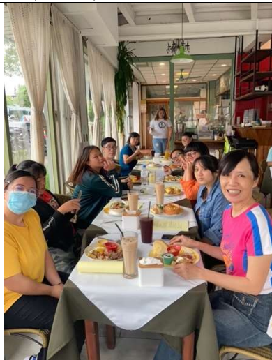
名稱：原住民共餐情形 日期：109 年度