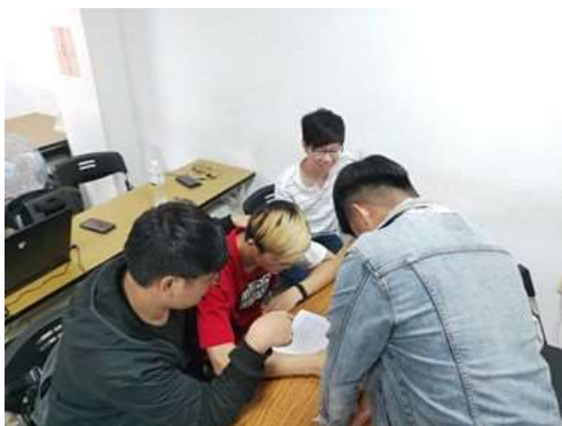
活動：同儕伴讀情形 日期：109 年度