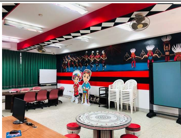
活動：優化原資中心休憩聯誼學習空間 日期：109 年 12 月 31 日