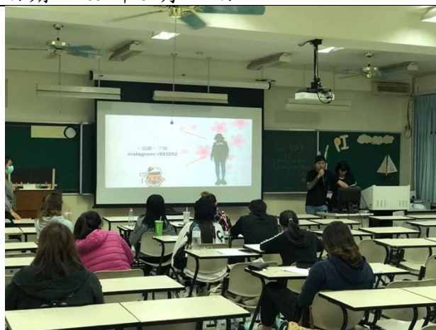
名稱：傑出原住民講座-不急夫婦 創業講座 日期：109 年 11 月 11 日