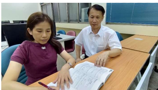
活動：專業課業輔導 日期：109 年度