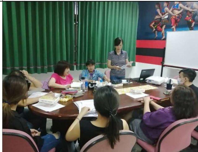
名稱：英文課業輔導 日期：109 年度