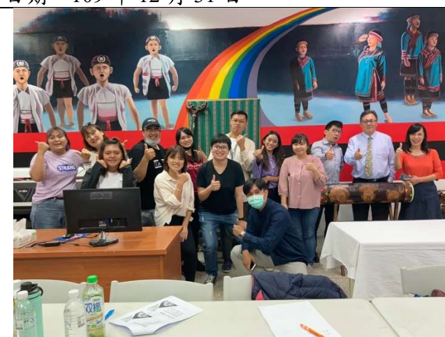
活動：東區大專校院原資中心夥伴學校業務 觀摩交流活動 日期：109 年 11 月 18 日